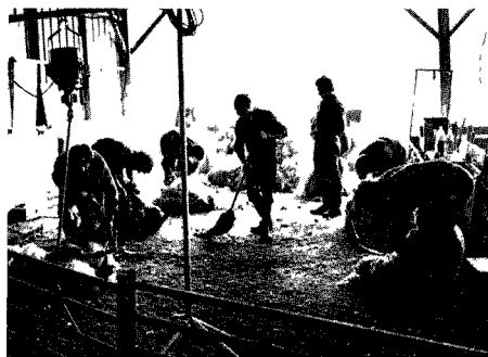
Stage ITOVIC Formation de Tondeurs

Avec une telle structure de stages de diverses sortes, la qualité de la tonte en France ne peut que progresser et la vitesse d'exécution (notre point faible) s'améliorer de façon sensible, ce qui d'abord augmentera le revenu des tondeurs et permettra ensuite aux meilleurs d'entre eux de se mesurer à chances égales avec les cracks des pays gros producteurs de laine.