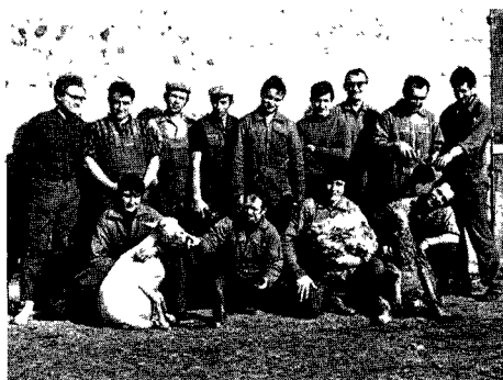
1er stage de perfectionnement ITOVIC 1972 SALON DE PROVENCE

Pour l'instant, il semble que 2 à 3 stages de perfectionnement par an et par groupe de 10 à 15 stagiaires soient suffisants. Ces regroupements et le travail qui s'y fait sont plus payants qu'il n'y paraît. On y corrige certes la technique au service du temps gagné et de la qualité de la coupe, mais aussi on s'y rencontre entre "compagnons" ce qui est toujours fructueux au sein d'une même corporation. On y échange ses idées, ses "trucs", parfois une partie de sa clientèle afin de mieux planifier sa campagne, etc. De plus, une journée est réservée aux constructeurs de matériel qui présentent leurs nouveautés, donnent les conseils d'emploi appropriés et doivent entendre aussi les critiques des usagers, si bien qu'en fin de compte tout le monde en profite. De toute façon, la tonte en sort améliorée.